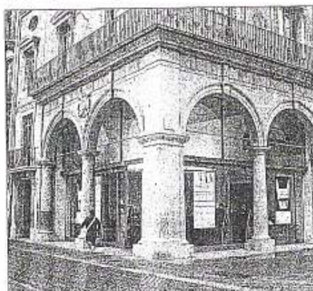
El acto tendrá lugar en la la Llotja del Cànon de Castellón

y Gobierno en el Instituto Neerlandés para la Investigación Social (SCP) y profesor de estudios de la sociedad civil en la Universidad de Tilburg. Actualmente sus campos de investigación se centran en los temas del sector sin ánimo de lucro, la participación social y política, la opinión pública, la sociedad y la política en los Países Bajos y la Unión Europea. La conferencia empieza a las 19:00 en la Llotja del Cànon de Castellón.